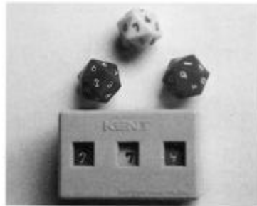
3색 난수(random number, 亂數) 추사위와 난수기