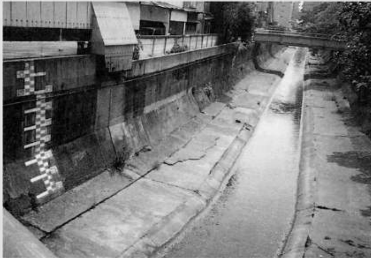
농업용수로 쓰는 도원천(桃園川, 모모즈노카와) 이름은 아름답지만 이전과 다르게 오염되었다(모리 나카노). 현재는 새롭게 고쳤다.