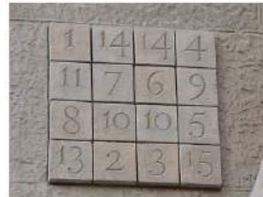
사그라다 파밀리아 성당의 마방진

n 차 마방진이란 가로줄과 세로줄이 각각 n 개이고 1부터 n^2 까지 자연수를 꼭 한 번씩 사용하여 가로줄과 세로줄 그리고 대각선 방향의 합이 모두 같도록 만들어진 것이다. 이것을 '마방진(魔方阵, magic square)'이라 이름 붙인 이유는 옛날 사람들이 이것을 때문에 붙여 놓으면, 나쁜 마귀가 밤새워 그 문제를 해결하느라고 집안에 들어올 수 없다고 여겨서 '마귀를 쫓는' 부적의 의미를 가지게 되었다. 유럽의 점성술사들은 이것을 은판에 새겨서 부적으로 이용했다.