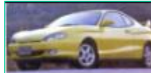
1996 현대 티뷰론