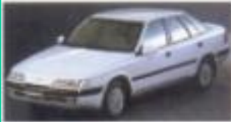
1990 대우 에스페로