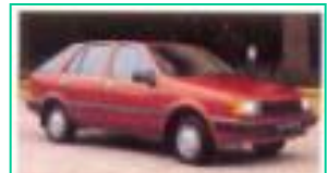
1982 현대 포니엑셀