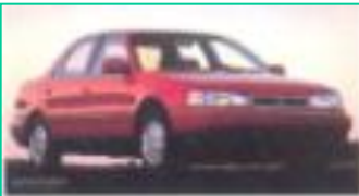
1990 현대 엘란트라