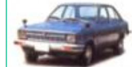
1977 새한 제미니