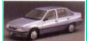
1986 대우 르망오펠 카데트)