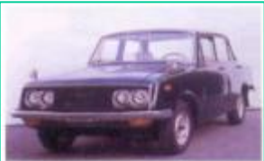
1966 신진 (토요타)코로나