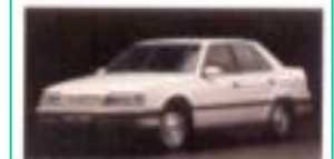
1988 현대 소나타