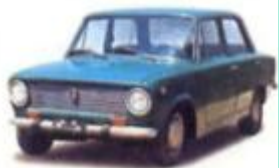
1970 아시아 (피아트)124