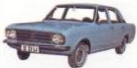
1968 현대 (포드)코티나