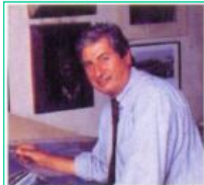
이탈디자인의 조르제토 주지아로(Giugiaro Giugiaro)