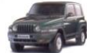
1996 쌍용 뉴 코란도