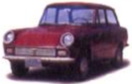
1966 신진 (마쓰다)퍼블리카