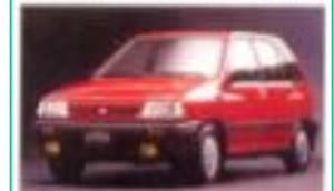
1987 기아 프라이드(포드 퍼스티버)