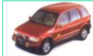
1993 기아 스포타지