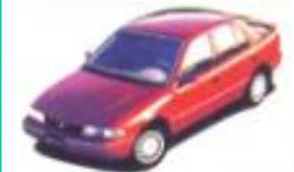
1992 기아 세피아