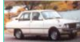
1974 기아 (마프다)브리사