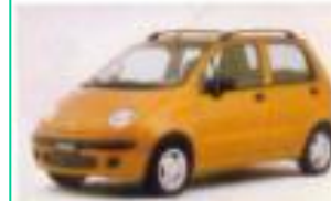
1998 대우 마티즈