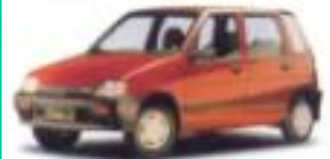
1991 대우 티코