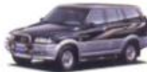
1994 쌍용 루쏘