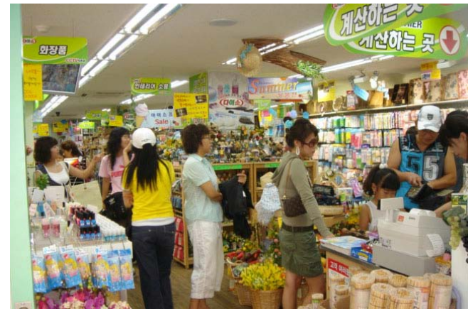
<고가의 신세계 백화점>