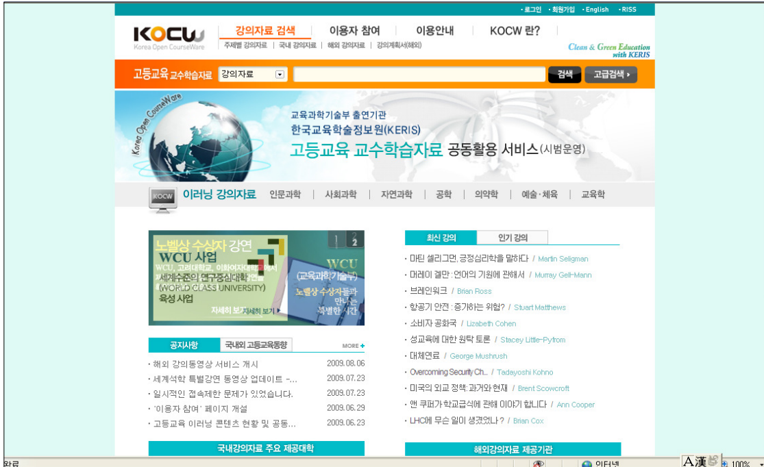
[그림 KOCW 메인 화면 (2009년 현재)]