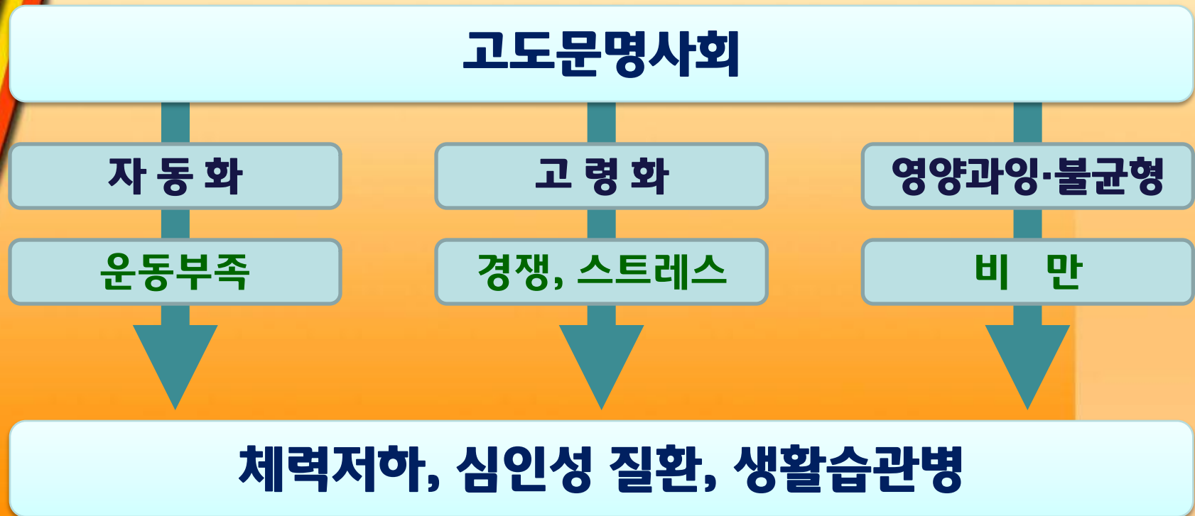
그림 2-2. 현재의 생활환경과 건강